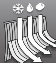
SNOW & MUD FLAPS

Puedes abrir casi todos los paneles laterales de la tienda, permitiendo que el viento saque el aire caliente de la tienda, para un mayor confort.