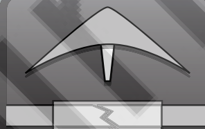
REPAIR TUBE IN SPACER

No hace falta enrollar la puerta y fijarla al techo. Nuestro sistema aumenta la velocidad y te hace la vida más fácil.